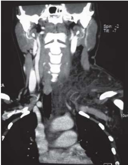
Figura 1. TC cervical, corte coronal: edema cervical extenso que se extiende hacia el mediastino.