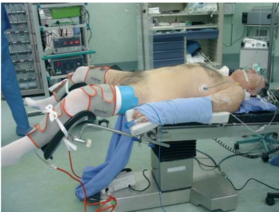
Figura 1. Posición de litotomía modificada para la cirugía.

La trigonización se realiza suturando la mucosa trigonal a la uretra con 3-4 puntos de Vycril 2-0, con aguja VR-6. Con esto no queda ninguna cavidad cruenta. Se coloca la sonda Foley triple vía n° 22 Fr. Se cierra la cápsula prostática y la vejiga con una sutura continua de ácido poliglicólico 0, con aguja CT-1 de 25 cm, realizando luego el llenado de la vejiga con 200 cc de solución fisiológica para comprobar la hermeticidad de la sutura. Se procede a la extracción de la pieza mediante morcelación por el puerto umbilical. Se comprueba nuevamente la hemostasia y se deja un drenaje aspirativo por contrabertura lateral. Se retiran los puertos de entrada bajo visión laparoscópica y se evacua el neumoperitoneo, suturando la aponeurosis de las punciones. Por último, se coloca irrigación continua de solución fisiológica por la sonda Foley para lavado vesical.