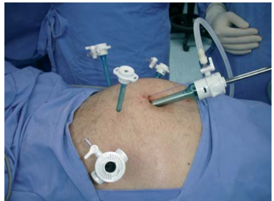
Figura 2. Posición de los puertos de trabajo.