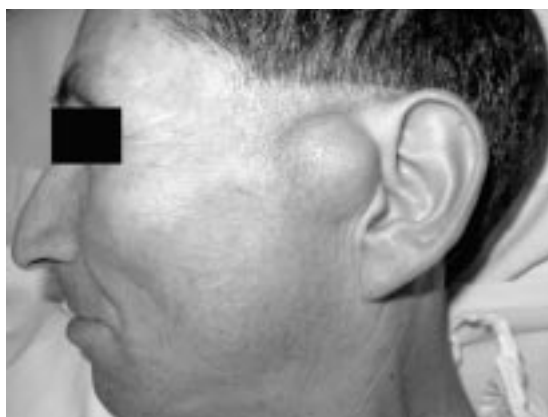
Figura 1. El paciente se presentó con esta masa de 3 cm de diámetro con crecimiento progresivo durante 4 meses tras recibir un golpe en una pelea.

La arteria temporal superficial es una de las dos ramas terminales de la arteria carótida externa.