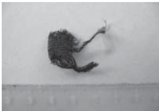
Figura 3. Cuerpo extraño extraído durante la exploración quirúrgica del trayecto fistuloso, correspondiente a tela.

utilizó antibióticos profilácticos. El cultivo del material extraído no presentó desarrollo bacteriano.