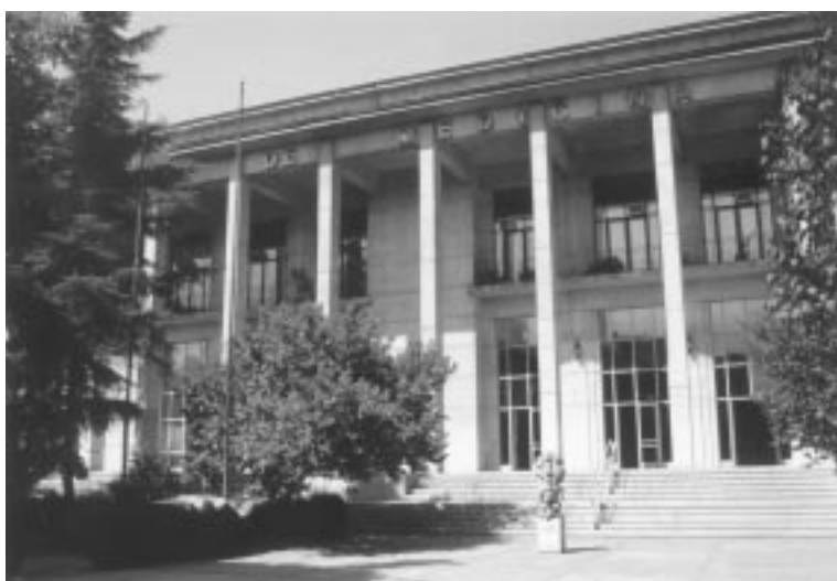
C. Actual sede de la Facultad de Medicina de la Universidad de Chile, Av. Independencia. Inaugurada en 1982.