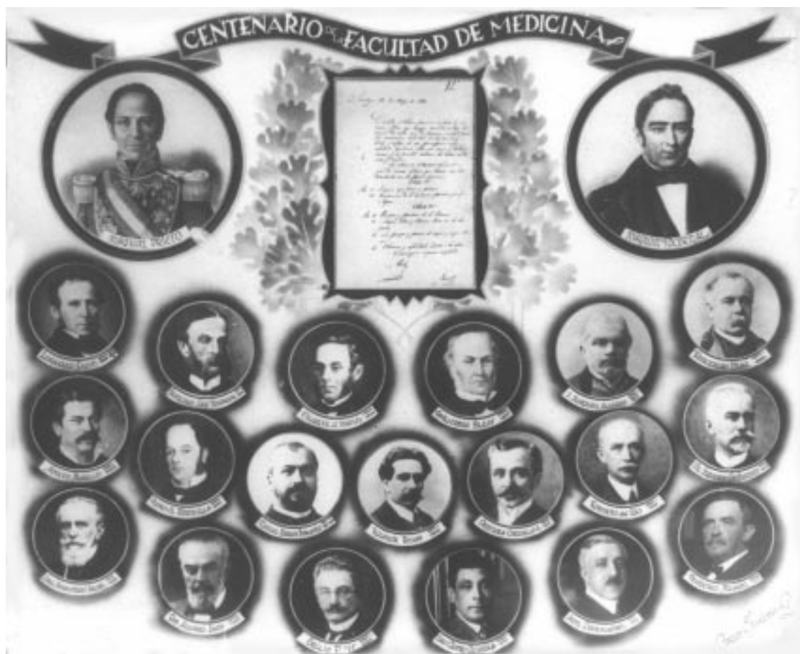
Figura 1. Galería de fundadores de la Escuela y Decanos de la Facultad de Medicina de la Universidad de Chile (1833-1933).