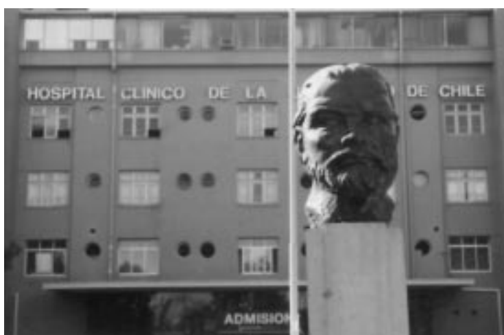
Figura 5. (A, B y C) Centros Docentes-Asistenciales de la Facultad de Medicina de la Universidad de Chile (secuencia histórica).