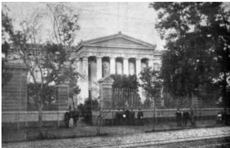
B. Segunda sede de la Escuela de Medicina de la Universidad de Chile, Av. Independencia (1889-1948).