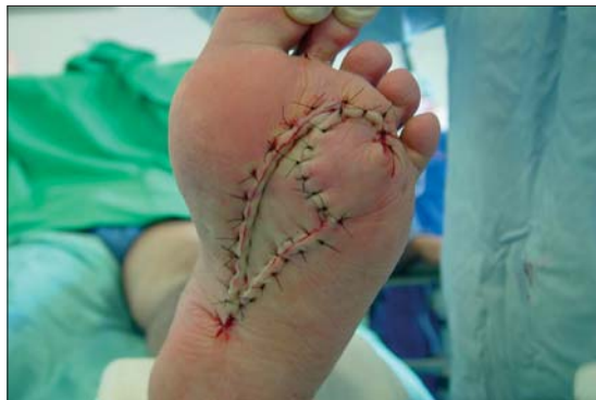
Figura 3c. Post operatorio inmediato.

que ello implica. Con el Colgajo en Cono, el colgajo de rotación local cubre completamente el defecto y la línea de sutura que une al colgajo en V-Y queda fuera y aparte del sitio del defecto.