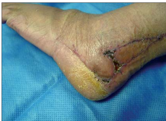
Figura 4d. Post operatorio tardío.

porque el plano infra y supra facial, con sus ricos plexos, están colaborando en su vitalidad dado que son incluidos en el colgajo fasciocutáneo de rotación y también en el colgajo de V-Y de avance. Ello es avalado científicamente por nuestro estudio anatómico.