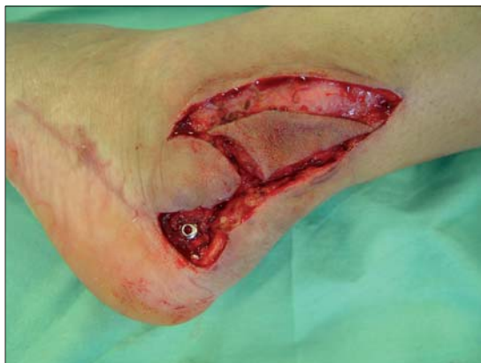
Figura 4b. Confección colgajo en cono.