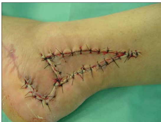
Figura 4c. Post operatorio inmediato.