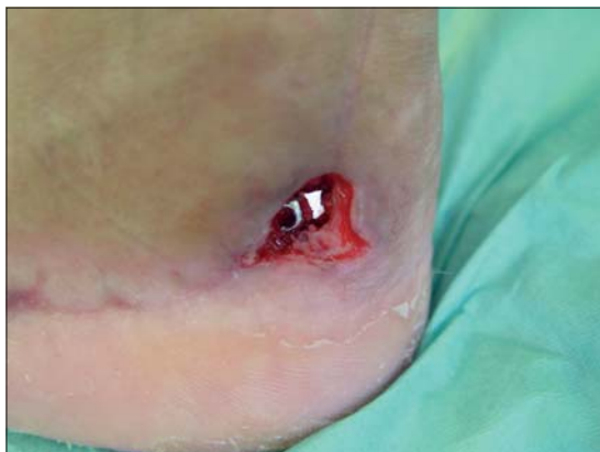
Figura 4a. Material de osteosíntesis expuesto en región retro maleolar peronea.