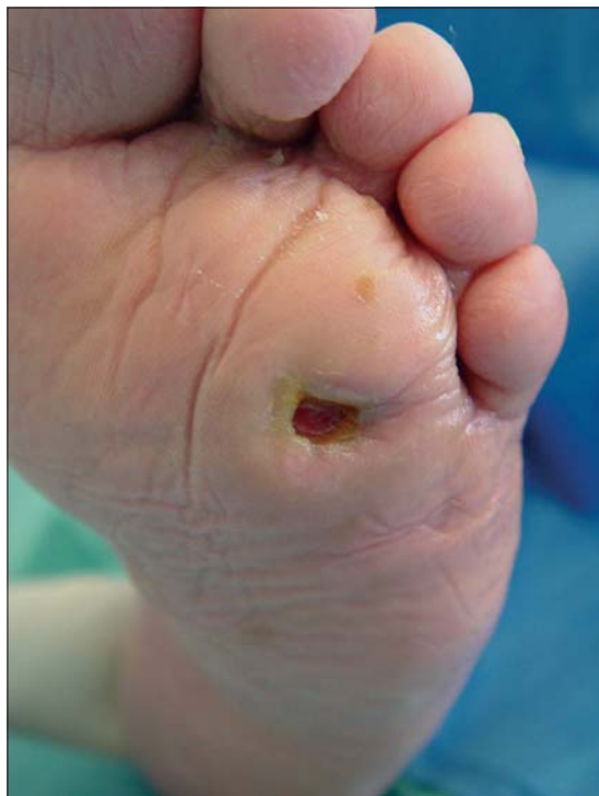
Figura 3a. Mal perforante plantar.