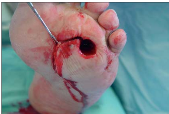
Figura 3b. (Derecha) Rotación de colgajo en cono.

Estudiamos aquellos correspondientes a hospitalización, pabellón, curaciones, horas médicas, con un total por procedimiento de Colgajo en Cono de US$ 2.367. Este costo se puede comparar con el de un colgajo muscular o miocutáneo libre con