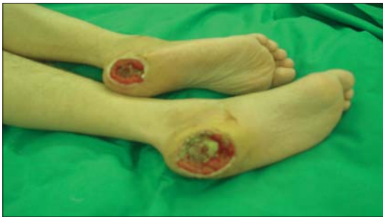
Figura 2a. Úlceras por presión ambos talones.