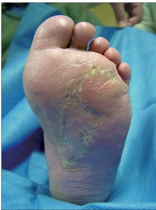
Figura 3d. Post operatorio tardío.

microcirugía, que llega a US$ 11.811 por cada procedimiento. Es decir la relación es de 1:5, Colgajo en Cono o Colgajo Libre microquirúrgico. Por lo tanto, el ahorro de medios para la institución que adopta este tipo de cirugía es muy importante. Si se elige este tipo de cirugía la realización técnica es sencilla, rápida y segura, y los resultados perduran en el tiempo. La razón de esto es el diseño simple, porque el colgajo está vecino al defecto, pero principalmente, por su rica irrigación.