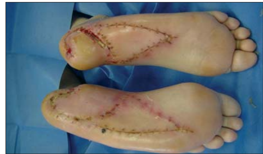
Figura 2b. Colgajo en cono para los talones.

Dado que el punto crucial de este colgajo es el cierre del defecto donante dejado por el colgajo de rotación local, es importante realizar un análisis geométrico del avance en V-Y, y cómo los tejidos, mirados desde el punto de vista geométrico, pueden permitir su fácil y seguro avance.