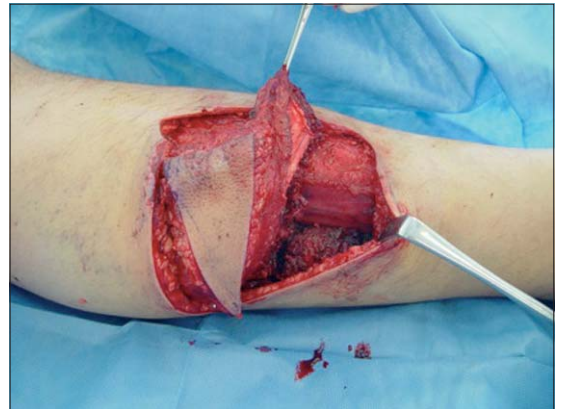
Figura 4. Colgajo de avance en V-Y tallado basado en la perforante de gastrocnemio medial identificada con ultrasonografía.