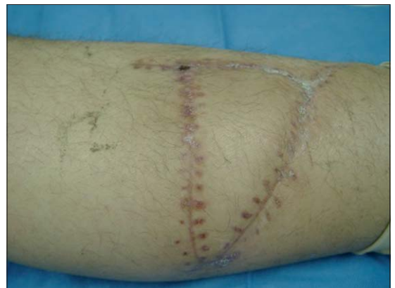
Figura 6. Resultado alejado a 3 meses.