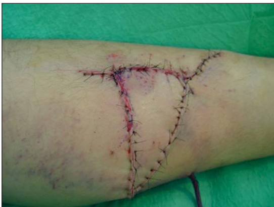
Figura 5. Resultado en el postoperatorio inmediato.