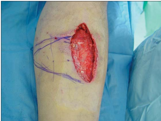
Figura 3. Defecto en tercio medio de la pierna con el colgajo diseñado.