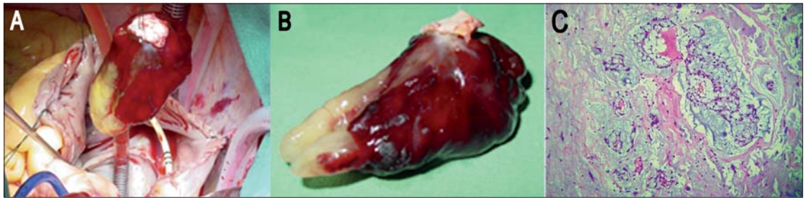
Figura 2. A. Fotografía intra operatoria al momento de la exéresis tumoral. B. Fotografía del tumor resecado. C. Estudio de anatomía patológica con tinción de Hematoxilina-Eosina concluyó mixoma (40X).

En circulación extracorpórea se realizó cirugía de revascularización miocárdica con dos bypass aorto-coronarios y exéresis del tumor (Figuras 2A y 2B). El estudio histopatológico concluyó mixoma (Figura 2C).