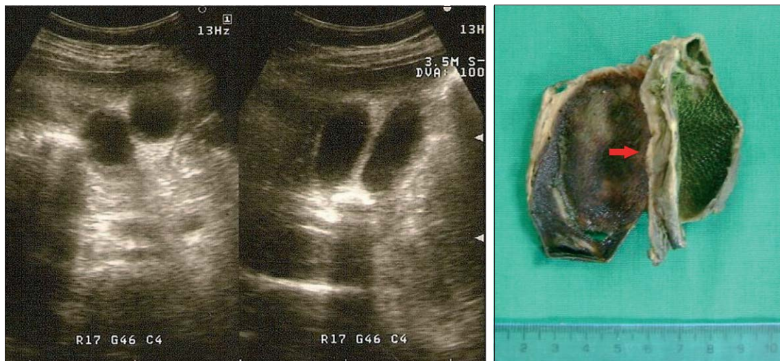
Figura 1. A) Ecotomografía abdominal que evidencia la presencia de dos lúmenes vesiculares y la sombra acústica de la litiasis B) Pieza quirúrgica constituida por dos vesículas biliares, una con presencia de colesterolesis. La flecha señala la zona de fusión de ambas vesículas.

La duplicación de la VB es rara, pero descrita desde tiempos ancestrales, inicialmente en animales y luego en humanos desde la época del Emperador Augusto el año 31 aC 1 . En 1674, Blasius describe el primer caso bien documentado en humanos. Estas no poseen síntomas específicos y las alteraciones patológicas no son más frecuentes en estos casos que en los pacientes con vesículas únicas 3,4 . La formación de cálculos es la complicación más común, usualmente desarrollada en una vesícula 4,5 , pero puede afectar ambas 6 . En 26 de 56 casos comunicados por Harlaftis 4 se confirmó después de la cirugía que la litiasis afectaba sólo una vesícula. Las patologías más comunes de la VB han sido descritas en duplicaciones vesiculares, incluyendo la colecistitis aguda y empiema vesicular 6 , colecistitis crónica 6 , fistulas colecistocolédocianas 7 , torsión vesicular 8 , papilomas 9 , colesterolesis 10 y carcinomas vesiculares 11 . En algunas circunstancias raras se ha relacionado con lesiones más graves, que incluyen anomalías de los conductos biliares, arteria hepática, malformaciones cardíacas, riñones