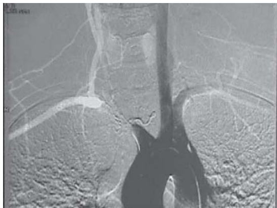
Figura 1. Angiografía de arco aórtico y vasos del cuello.