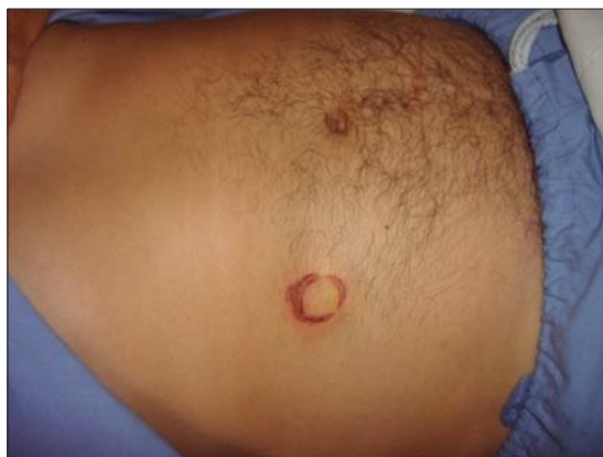
Figura 1. Huella de manubrio en pared abdominal.

anterior derecho de 3 cm, por la cual protruye epipión mayor (Figura 2). Sin lesiones intraabdominales. Control con TAC a las 48 hr no mostró cambios, permitiendo su alta. Cuatro semanas después se opera electivamente por vía laparoscópica instalando una malla PROCEED para cerrar el defecto (Figuras 3 y 4). Evolucionó sin complicaciones.