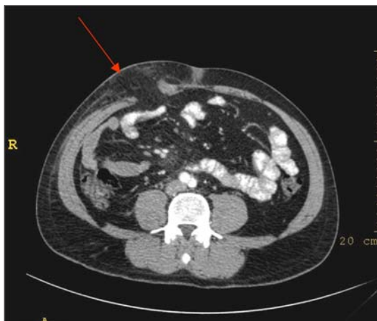
Figura 2. Tac de abdomen; flecha indica hernia traumática abdominal.

* Recibido el 22 de Agosto de 2008 y aceptado para publicación el 24 de Septiembre de 2008.