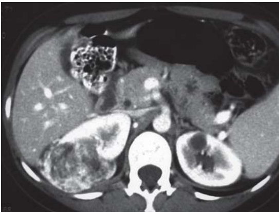
Figura 1. Tomografía axial computada que muestra gran lesión hipervascularizada y con contenido graso del polo superior derecho.

Respecto a su génesis se han postulado teorías sobre la presencia de receptores para estró-