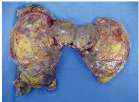
Figura 4. Imagen macroscópica con sección transversal de la lesión tumoral, mostrando al centro el margen de parénquima renal sano.