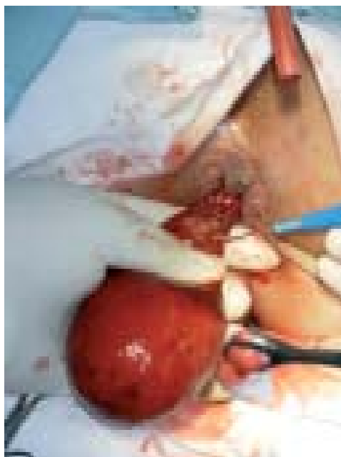
Figura 2. Resección transanal completa de la masa.

Se interviene con anestesia regional y se efectúa una resección completa de la masa protruida, suturando la base de implantación con Vicryl 3/0 por parcialidades (Figura 2). Alta al día siguiente y evolución sin complicaciones.