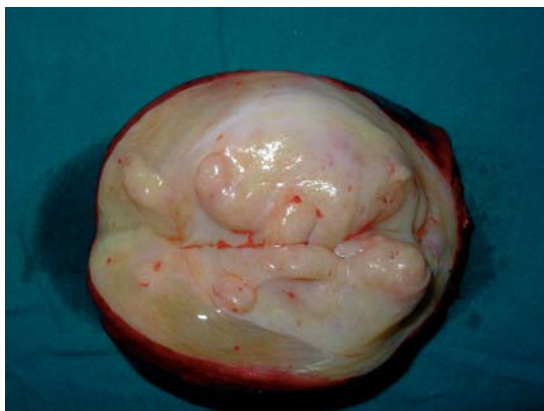
Figura 4. Pieza quirúrgica al corte.

Informe anatomopatológico: "Nódulo pardovioláceo de 8 x 5,5 x 5 cm de superficie lobulada amarilla grisácea, sólida, elástica y brillante. Tumor submucoso mesenquimático mixto constituido por tejido adiposo maduro y conectivo laxo con extensas áreas mixoides ricamente vascularizadas, sin atipias ni mitosis. Rectitis crónica ulcerativa y hemorrágica (Figuras 3 y 4). Asintomática desde el punto de vista proctológica luego de un año de seguimiento.