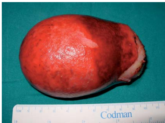
Figura 3. Pieza quirúrgica (cara externa).