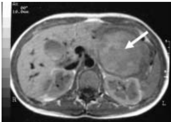
Figura 1. Imagen axial de RM en la que se aprecia la tumoración dependiente de cola de páncreas (flecha blanca).

Mujer de 14 años que acude a urgencias por dolor abdominal de 3 días de evolución, localizado en hipocondrio izquierdo e irradiado a espalda, junto con febrícula de 37,4°C, náuseas y vómitos. Sus constantes eran normales y en la exploración abdominal se apreciaba masa en hipocondrio izquierdo, algo dolorosa a la palpación. La analítica sanguínea y la radiografía de tórax fueron estrictamente normales. En la radiografía simple de abdomen sólo se apreciaba un descenso de ángulo esplénico de colon. Los marcadores tumorales como CEA y CA 19.9 fueron normales. Se practicó Tomografía Computerizada (TC), observando una masa de consistencia irregular, de 7x4 cm, dependiente de cola de páncreas. La Resonancia Magnética (RM) confirmó los anteriores hallazgos (Figura 1). Se intervino de forma electiva a la paciente, encontrando una tumoración dependiente de cola de páncreas, muy vascularizada, encapsulada y adhe-