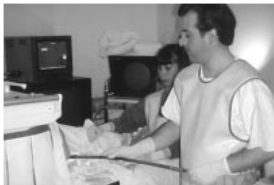
Figura 2. Se avanza la bujía de Savary-Gilliard sobre la guía metálica de Eder.

El diagnóstico de estenosis se efectuó mediante endoscopia en todos los pacientes, lo que se complementó con una radiografía contrastada en 7. El diámetro promedio de la estrechez fue 7 mm (extremos 2-10). El intervalo entre la confección de la CRA y el diagnóstico de la complicación fue de 19 meses como promedio (extremos 2-67). En el 60% de los casos el diagnóstico se realizó después de 12 meses de la intervención. Previo al diagnóstico de estenosis tres pacientes registraban una endoscopia normal con anastomosis amplia y franqueable por el instrumento rígido. En 4 pacientes asintomáticos la estrechez crítica se certificó en una endoscopia de control en el marco de un protocolo de seguimiento prospectivo de una CRA 4 . Once pacientes (73%) presentaban dolor y distensión abdominal, constipación y dificultad para evacuar y un paciente refirió alternancia de esta sintomatología con diarrea intermitente. En 5 pa-