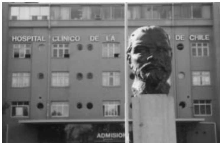
Figura 5. (A, B y C) Centros Docentes-Asistenciales de la Facultad de Medicina de la Universidad de Chile (secuencia histórica).