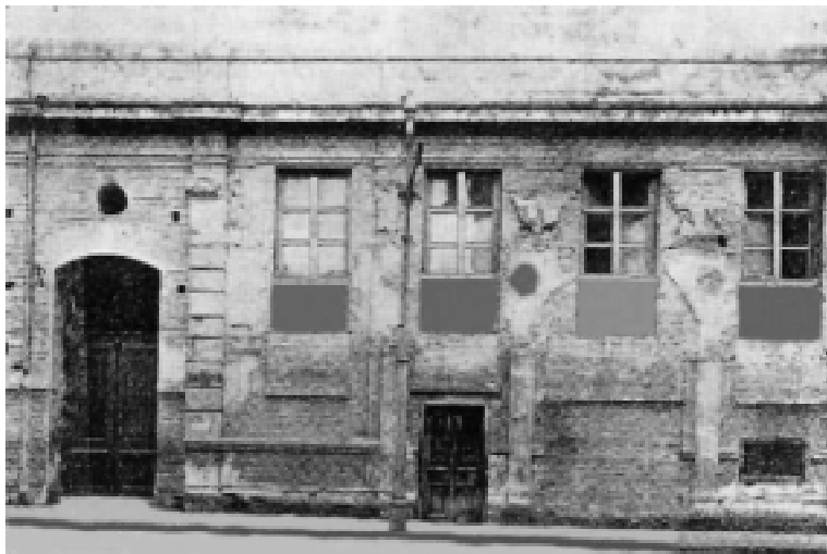
A. Antiguo edificio de la Escuela de Medicina de la calle San Francisco (1857-1889).