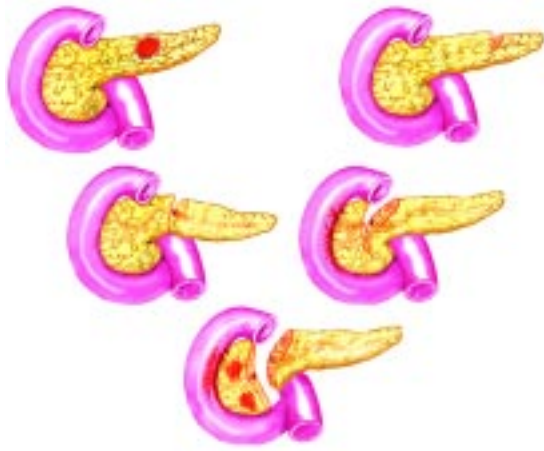
Figura 1. Esquema de lesiones pancreáticas desde grado I a V.