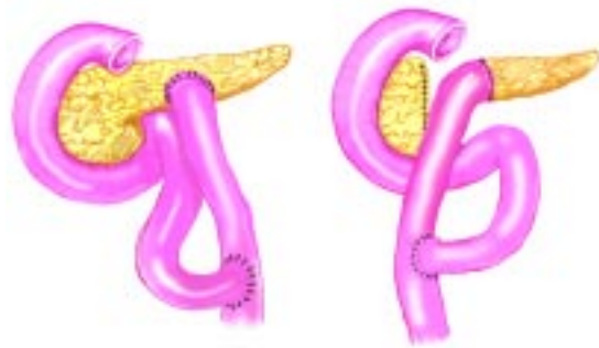
Figura 2. Esquema de pancreatoyeyunostomías. A) Al sitio de ruptura. B) Al muñón pancreático.