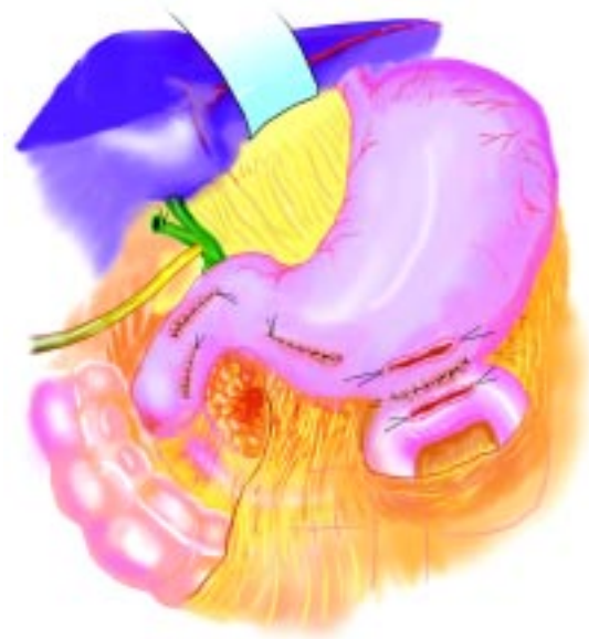
Figura 4. Esquema de exclusión pilórica.