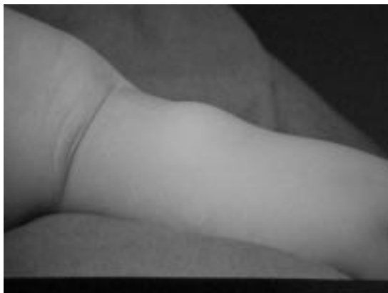
Figura 1. Aneurisma humeral izquierdo en lactante de 14 meses.

Dada la naturaleza de las afecciones asociadas y la eventualidad de aparecer nuevos aneurismas, se mantendrá permanentemente bajo control.